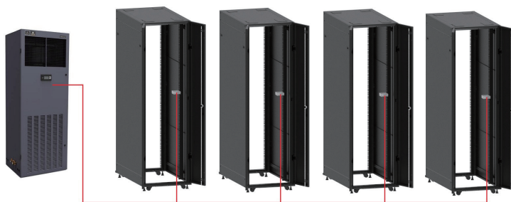
节能卡安装示意图